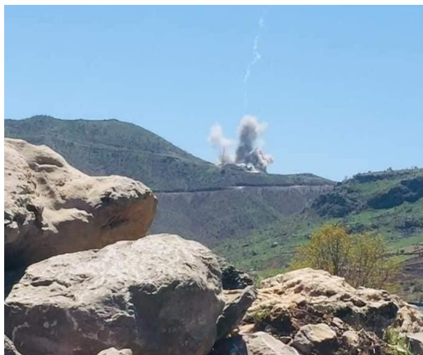
Figure 1 به‌رزبوونه‌وه‌ی دو‌کهل له‌سه‌ر زینی نه‌ستیرۆکان، له‌دوای هه‌رشه‌ی ناسمانی تورکیا.

له ۱۴ی نیساندا، هه‌زی ناسمانی تورکیا ده‌ستیکرد به‌ بۆردوومانکردنی زینی نه‌ستیرۆکان. سه‌رجه‌می هه‌رشه‌ ناسمانییه‌کانی تورکیا بۆسه‌ر زینی وه‌رتی له‌ مانگی نیسانه‌وه‌ بۆ مانگی ئایار ۶ هه‌رش بوو. میدیا ناو‌خۆبیه‌کان ناما‌زه‌یان به‌وه‌دا که‌ هه‌رشه‌کان گه‌ریلاکانی په‌که‌که‌یان به‌ نامانج گرتبوو، وه‌ ژماریه‌ک پێشمه‌رگه‌ش که‌ له‌باره‌گا‌کانی‌اندا بوون له‌و هه‌رشانه‌دا برینداربوون. زه‌ویوزاره‌کانی ده‌ورووبه‌ری شوینی بۆردوومانه‌کان که‌ له‌لایان هاو‌لاتیانی ناوچه‌که‌وه‌ به‌کارده‌هه‌نران زۆر به‌ خراپی وێران بوون. شوانیکی خه‌لکی دۆلی شاورئ به‌ "سی پی تی" گووت، که‌ فرۆکه‌ جه‌نگییه‌کان ئه‌و له‌مه‌رگا و ناوچانه‌یان بۆردوومانکردوه‌ که‌ ئه‌وان پێشتر به‌کارباند هه‌نیا بۆ له‌مه‌راندنی