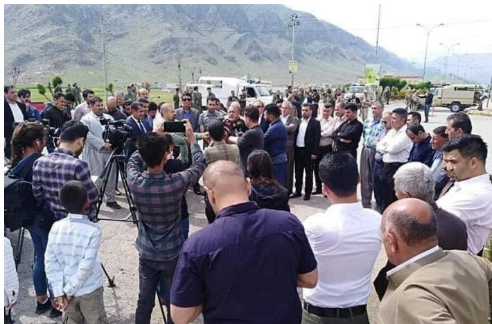
گرددبوونهوهی خۆپیشاندهران و قسهکردنیان بۆ میدیاکان، له داوای رینگهکردن Figure 2 لێیان بۆ ئەنجامدانی رینپوان.

سهرباری جیبهچی نهکردنی به ئینی لابرندی بارهگا سهربازیهکه، چیتیش رینگه نههرا به ئەنجامدانی خۆپیشاندان له دژی دروستکردنی ئەو بارهگایه.