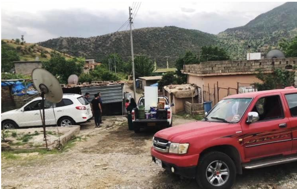
لههواوی بۆردوومانکردنی گوندهکهیان، گوندشینیانی کیشه گوندهکهیان بهجیدههیلن.

تاوهکو کۆتایی مانگی ئایار، بهلایهنی کهمهوه ۷۲۰ هاولاتی مهدهنی له گوندهکانی کیشه، چهلکی، هورری، ئهدهنی، میسکه، سههرهۆ و دشیشی بههۆی ئۆپهراسیوننی چنگی-ههوره بروسکهوه گوندهکانیان چۆلکردوه و ئاوارههبون.