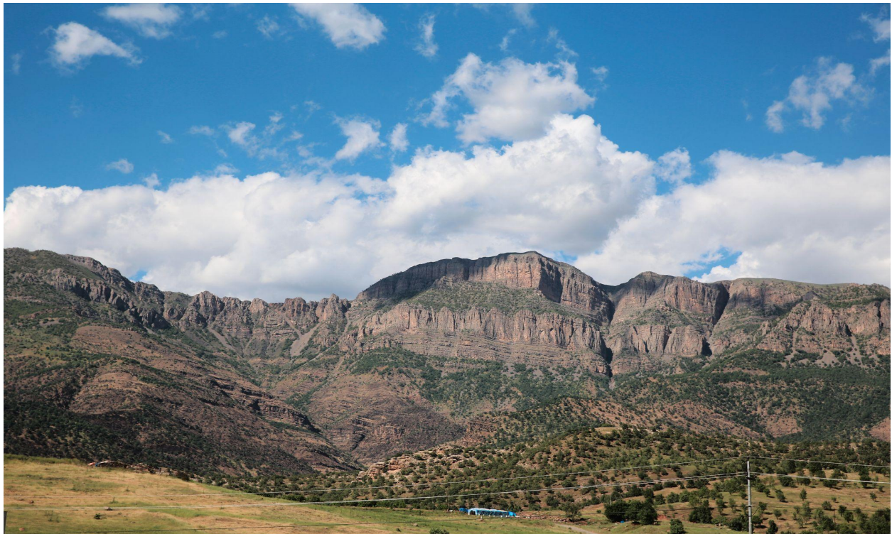
بیتانیکی سوتاو بههوی بوردومانه کانی تورکیا له زناری کئیسته.

زناری کئیسته دهکهوئیه چهند کیلۆمتریک له خوار باشوری سنوری نیوان تورکیا-عیراق و ۲،۳۰۰ کیلۆمتر له ناستی روهی ده ریاوه بهرزه و به بهرزترین شاخ دادهنریت له سنوری ناحیهی کانی ماسی-دا. پانتایی دامینی چیاکه به داری میوه و زهوی کشتوکالی و لههه رگای نازهل داپوشراوه که سهه رچاوهی دابینکردنی بژیوی ژیانی زیاتر له ههزار هاولاتی گونده کانی کئیسته، هه روهی، چه لکی، ئوره، ئه دنی، سهه رۆ، دشیشی، میسه که و گونده کانی ترن. بهه هه می سهه رکی نهو گونده انه میوه، سهه زه، مزرهه منی و گیای خۆرسکه. وه ئه و گونده انه ریزهیه کی زۆری ههنگوین، ماست، گوشت و هیلکه بهه هه دههینن.